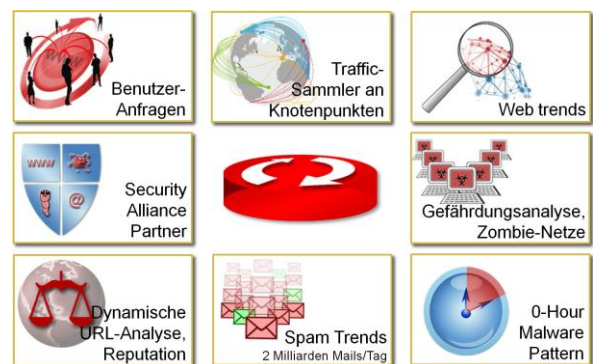
Abb. 2: Datenquellen für Pallas URL-Filter (© Commtouch)

Bei den heutigen schnell wechselnden Bedrohungen im Web ist ein Filter, der möglichst viele URLs kennt und sehr schnell klassifizieren kann, von besonderer Wichtigkeit. Im Test mit 25.000 zufällig ausgewählten URLs hat der Pallas URL-Filter mit einer Erkennungsrate von mehr als 98 % besonders gut abgeschnitten (siehe Abb. 1). Das liegt an der Fülle der Datenquellen und der Einbeziehung von automatisch analysierten Informationen (siehe Abb. 2).